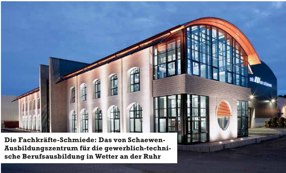
Die Fachkräfte-Schmiede: Das von Schaewen-Ausbildungszentrum für die gewerblich-technische Berufsausbildung in Wetter an der Ruhr