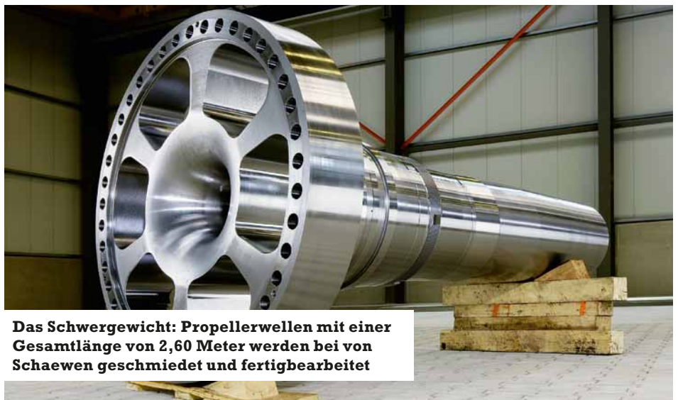
Das Schwergewicht: Propellerwellen mit einer Gesamtlänge von 2,60 Meter werden bei von Schaeuwen geschmiedet und fertigbearbeitet

von Schaeuwen AG Kronprinzenstraße 14 · 45128 Essen Tel.: 02 01 / 81 10-0 info@von-schaeuwen.de www.von-schaeuwen.de